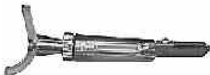
31 163 00 TC 9P Thomas Grip Rainbow Schaft neonfarben / neon colored grip