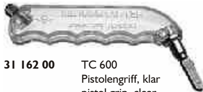
31 162 00 TC 600 Pistolengriff, klar pistol grip, clear