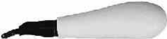
31 125 00 Hobby Long Life 424.0 SW 120°, HM, Längenverstellbarer Kunststoff-Schaft Adjustable length plastic shaft