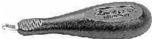
31 127 00 Easy Grip 128.01 SW 120°, ST, mit Gleitschuh / with sliding block