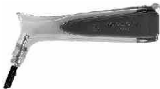
31 298 00 M700 mit Pistolengriff / pistol-Cutter

ERSATZKÖPFE für alle MITSUBOSHI-Modelle REPLACEMENT HEADS for all MITSUBOSHI cutters